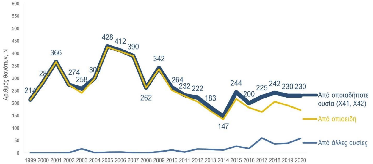
Γράφημα 5.1: Διαχρονικές τάσεις στον αριθμό των θανάτων που καταγράφηκαν από την ΕΛΣΤΑΤ και οφείλονται σε τυχαία δηλητηρίαση από τη χρήση ουσιών (υπερδοσολογία), για το σύνολο των εμπλεκόμενων ουσιών και ξεχωριστά για τα οπιοειδή, και ουσίες εκτός οπιοειδών (1999-2020).

ΕΠΙΨΥ ΕΚΤΕΠΝ ΕΡΕΥΝΗΤΙΚΟ ΠΑΝΕΠΙΣΤΗΜΙΑΚΟ ΙΝΣΤΙΤΟΥΤΟ ΨΥΧΙΚΗΣ ΥΓΕΙΑΣ, ΝΕΥΡΟΕΠΙΣΤΗΜΩΝ ΚΑΙ ΙΑΤΡΙΚΗΣ ΑΚΡΙΒΕΙΑΣ "ΚΟΣΤΑΣ ΣΤΕΦΑΝΗΣ" ΕΘΝΙΚΟ ΚΕΝΤΡΟ ΤΕΚΜΗΡΙΩΣΗΣ ΚΑΙ ΠΛΗΡΟΦΟΡΗΣΗΣ ΓΙΑ ΤΑ ΝΑΡΚΩΤΙΚΑ